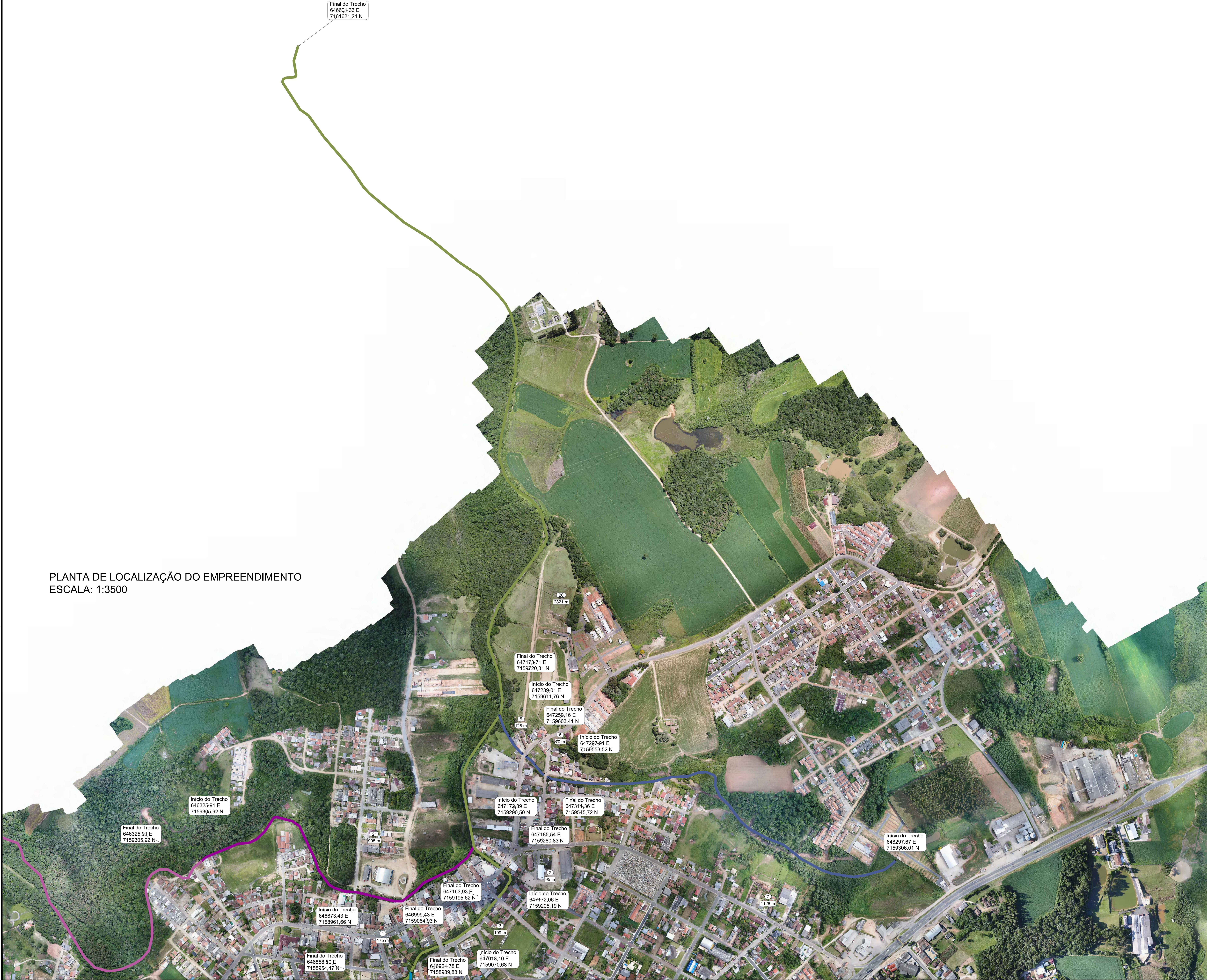
PLANTA DE LOCALIZAÇÃO DO EMPREENDIMENTO ESCALA: 1:3500